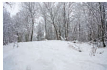
Rahvajuttude järgi olla siin nähtud lahkeid haldjaid ja metsavaime.

Paberil ilusasti kõlavad kaitsemeetmed pole tegelikkuses päriselt rakendunud. Jõudnud mäe juurde, möödume tervisespordikeskuse hubasest hoonest. See on mõeldud teenindama nii üksikkülastajaid kui ka rahvarohkeid spordivõistlusi. Nende tarvis on mõne aasta eest hiiemetsa raiutud