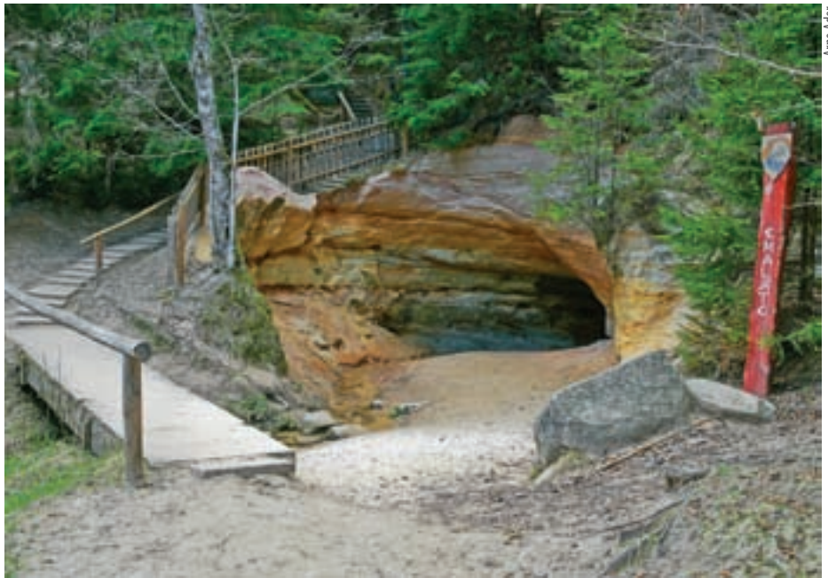
Emalätte juures pestakse silmi ja poetatakse vette raha, teadlikumad kraabivad anniks hõbevalget.

Jalutades edasi näeme jões suurt ümarat kivi – Nõia- ehk Salakuu-